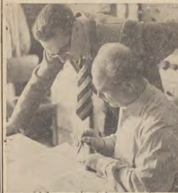
Besprechung anhand der Partitur.

G. Die vergangenen drei Tage werden in die treiben waren. Man besprach die gange Frage mit wirb still — man tonnte eine Nadel sallen hören — Annalen ber Schallplattenausnahmen in der Schweiz herrn Schultses, dem tinstlerischen Mitarbeiter der aus dem Aufnahmeraum, der in der Radiofammer eingehen. Denn an ihnen wurden Grammophonplats untergebracht ist, ertont ein ten befpielt, Die, Die Runft eines ichmeigerifchen Or chefters feithaltend, erftmals im Belthandel erhalt lich sein werben, war es bisher boch fo, daß alle Auf-nahmen, die in unserm Lande porgenommen worden find, ausschließlich in ber Schweis pertauft werden