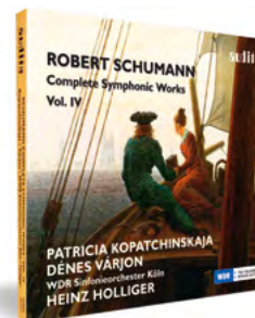
Vol. IV audite.de/97717