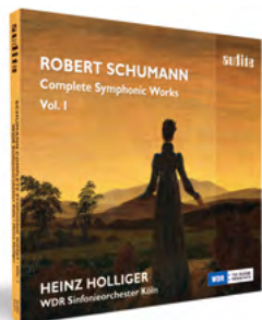
Vol. I audite.de/97677

Bereits mit dem WDR Sinfonieorchester Köln und Heinz Holliger bei audite erschienen: Robert Schumann: Die Sinfonischen Werke Vol. I - IV