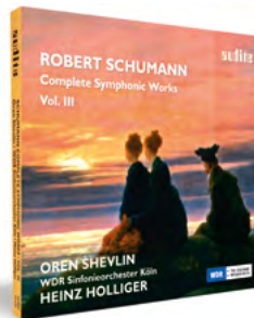
Vol. III audite.de/97679