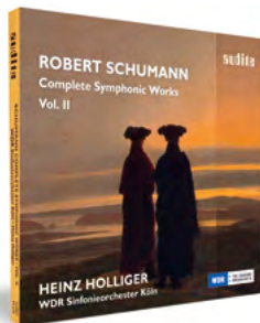
Vol. II audite.de/97678